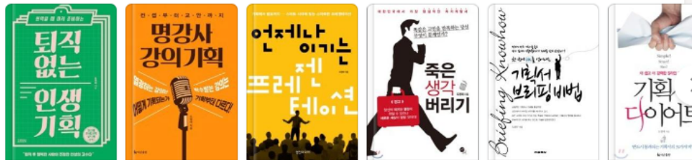
퇴직 없는 인생 기획(현... 김영사 명강사 강의 기획(컨셉부... 더난출판사 언제나 이기는 프레젠테... 영진미디어 죽은 생각 버리기 무한 기획서 브리핑 비법(한... 교학사 기획서 다이어트(Simple 더난출판사